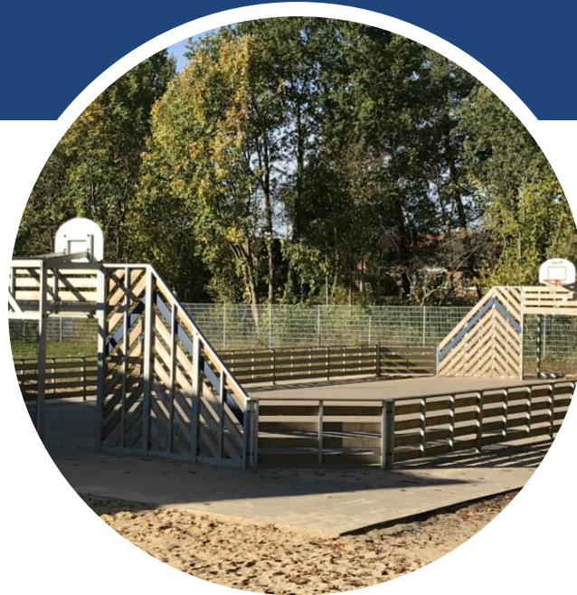
Multifunktionsfeld für Sport, Ganztag und Pausen